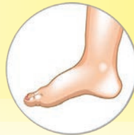
— Οίδημα - Πόνος