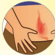
— Εξάνθημα (Κοκκινίλα)