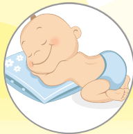
— Παράτριμμα (Σύγκαμα)