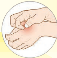
— Κνησμός (Φαγούρα)