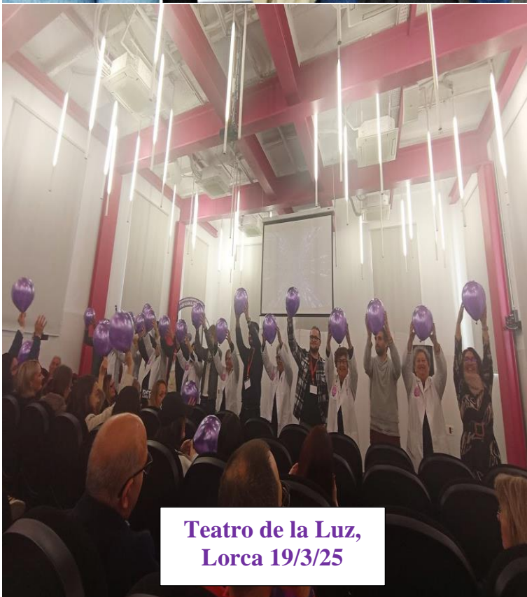
Teatro de la Luz, Lorca 19/3/25