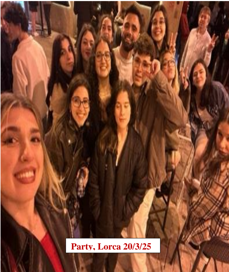
Party, Lorca 20/3/25