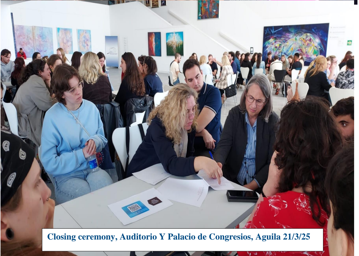
Closing ceremony, Auditorio Y Palacio de Congresos, Aguila 21/3/25

plazo Blended Intensive Program UNIVERSITY PARTY JUEVES 20/03 CENA DE PRODUCTOS LOCALES 20:00H - 21:30H MUSIC SET CELSO DJ 21:30H - 04:00H CAMPUS UNIVERSITARIO DE LORCA