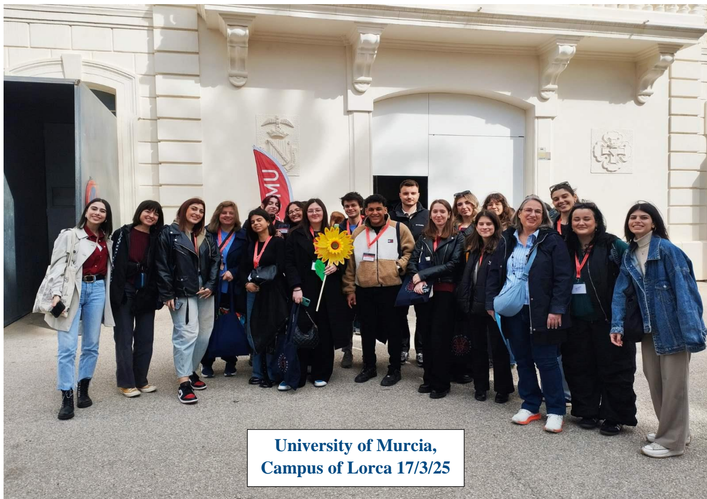
University of Murcia, Campus of Lorca 17/3/25